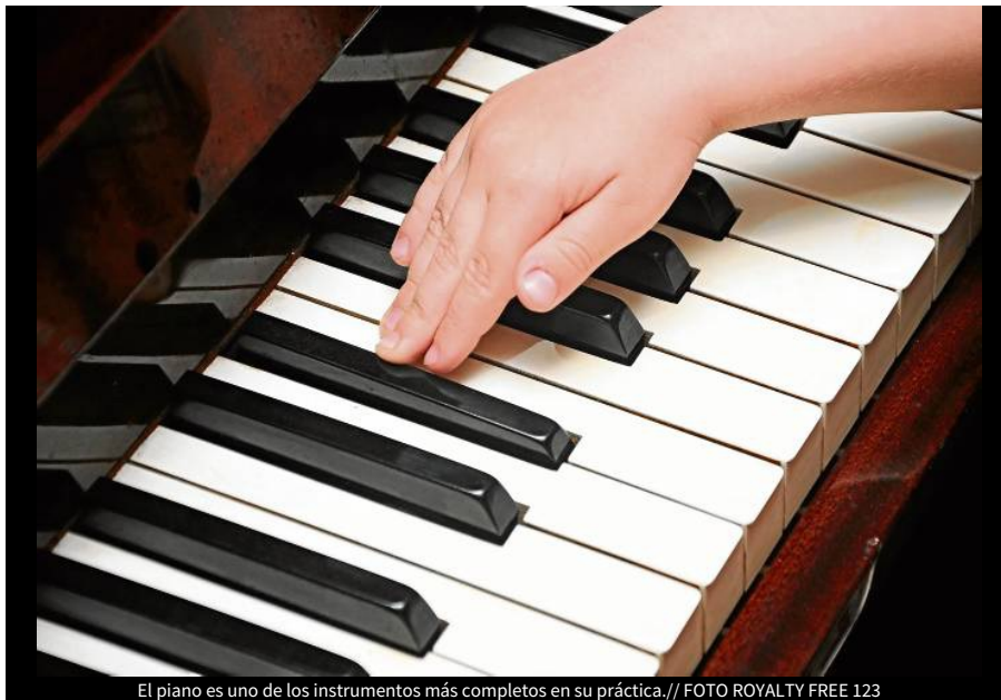
El piano es uno de los instrumentos más completos en su práctica.

@ElUniversalCtg | 10 de agosto de 2012 12:01 AM |